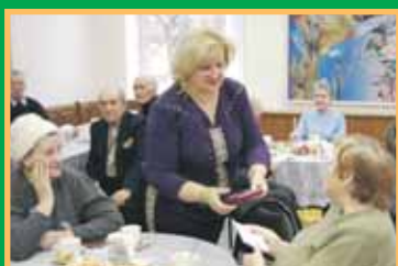
Ветеранам вручают медали