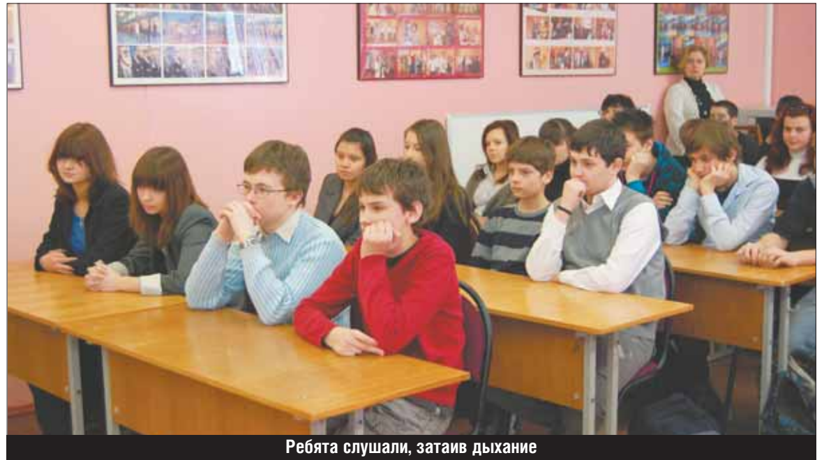
Ребята слушали, затаив дыхание

В 1949 году Уткин поступил на артиллерийский факультет Военно-политической академии, которую он окончил с золотой медалью. После этого Борис Павлович находился на