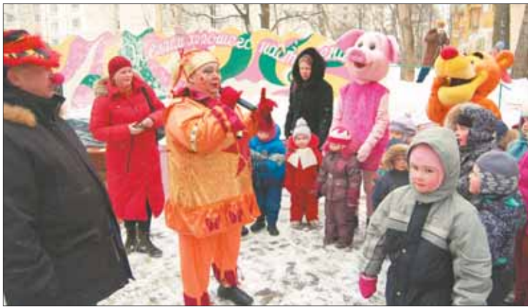
Уже не первый год проводит празднование Масленицы для жителей района муниципальное учреждение «Центр детского творчества,

искусства и спорта «Хорошее настроение».