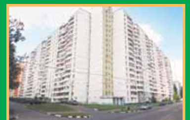
Как дела, ТСЖ?