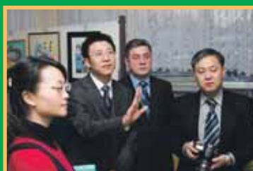
Дружба без границ