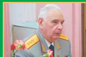
Уроки генерала Уткина