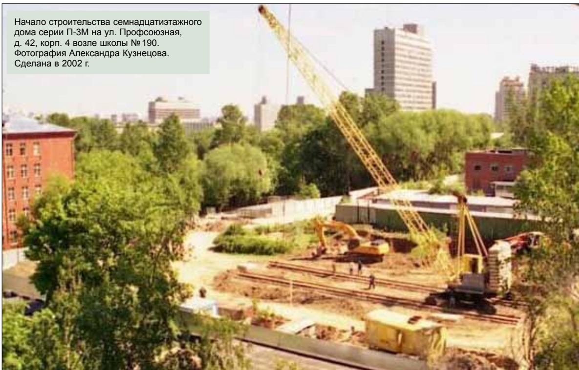
Начало строительства семнадцатипятиэтажного дома серии П-3М на ул. Профсоюзная, д. 42, корп. 4 возле школы № 190. Сделана в 2002 г.