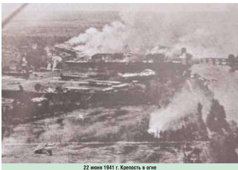
22 июня 1941 г. Крепость в огне

пость была первоклассной и по тем временам практически неуязвимой. В течение столетия крепость совершенствовалась и модернизировалась.