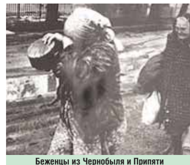
Беженцы из Чернобыля и Припяти

31 апреля поступила команда командующего войсками округа В.В. Осипова: подыскать место для прибывающей 25-й бригады химической защиты в район деревни Лево, что в шести километрах севернее Чернобыля. Мы обследовали район дислокации бригады, замерили радиационный фон — он составлял 280 мр/час, что в 30 раз превы-