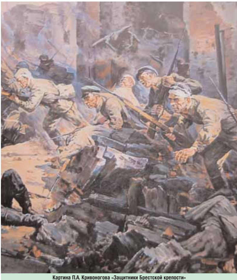
Картина П.А. Кривоногова «Защитники Брестской крепости»

Есть такие события в истории человечества, которые с нами навсегда. Навсегда с нашими потомками и с их детьми. Серьезные ученые посвящают изучению этих событий всю свою жизнь. В районе Черемушки живет человек, который долгие годы жизни посвятил изучению одного из таких великих исторических событий — обороне Брестской крепости в 1941 году.