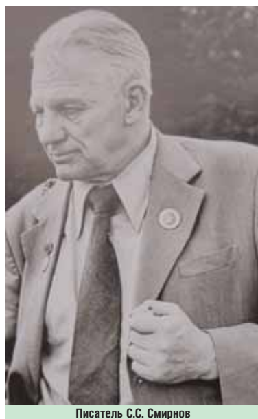
Писатель С.С. Смирнов

книг. Впервые интерес к обороне цитадели проявил писатель Сергей Смирнов в книге «Брестская крепость». Книга вышла в 1957, в 1965 г. Автор получил за нее Ленинскую премию. Эта книга — итог многолетней деятельности писателя, решившего воссоздать невероятный подвиг людей, который долго оставался полностью неизвестным. Героизм защитников цитадели был продолжен отважным стремлением писателя рассказать честную, полную драматизма правду.