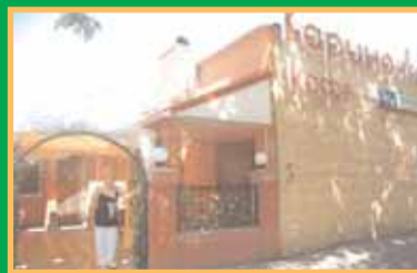
Угощение на любой вкус