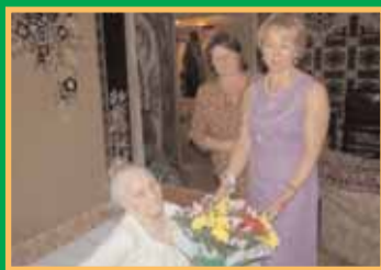
Какие наши годы!