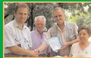
В центре внимания единокороссов